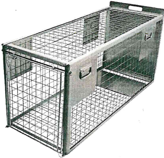
Рисунок 1 Клетка-ловушка (собаколовка) в закрытом виде

Клетка-ловушка (собаколовка) (рисунок 1,2) - предназначена для отлова животных средних размеров до 60 кг.